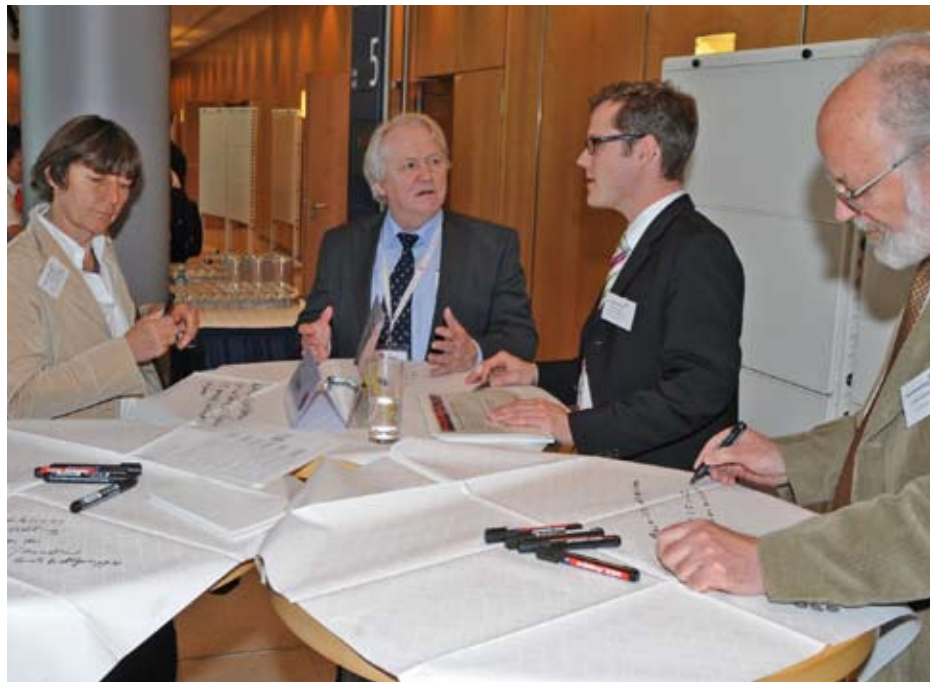
Teilnehmende des dbb-Kongresses diskutierten im World-Café an Thementischen. Ergebnisse wurden direkt auf den Tischdecken festgehalten.

Das entspricht auch den Erkenntnissen der Hirnforschung: Wer Neues und Überraschendes erlebt bzw. tut, verlässt die ausgefahrenen Bahnen des Gehirns und schafft neue Wege und Synapsen.